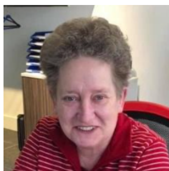
LEDENADMINISTRATIE / REDACTIE ANJA TROOSTER