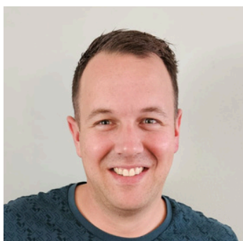
HOOFDLEIDER KIDS / KABOUTERS