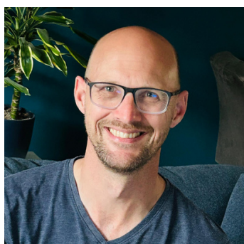
SPORTLINK EN WEDSTRIJDPLANNING