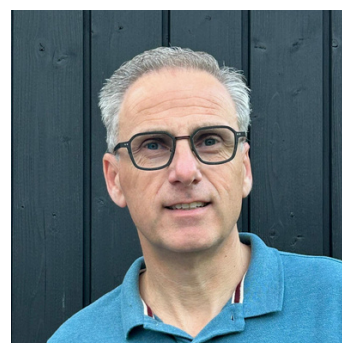
WEDSTRIJDEN EN CONTACT VERENIGINGEN