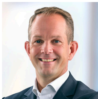
BESTUURSLID VOETBALZAKEN JEUGD