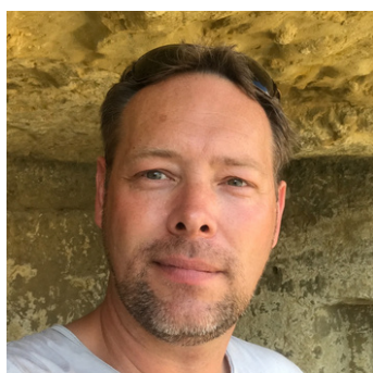
WEDSTRIJDEN EN CONTACT VERENIGINGEN